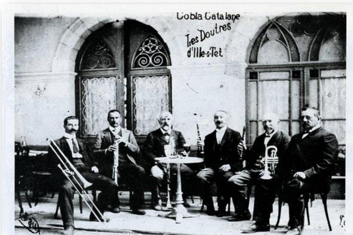
Cobla catalane de la famille Doutre, Ile de Tret, 1908.

Les concours ont donné lieu à une série de discussions et d'analyses. D'une part, le répertoire, entre le cultivé et le populaire, avait un désir clair d'amender les performances des sociétés. Les pièces préétablies (imposées) ont été considérées comme exemplaires par les organisateurs, et les œuvres à choix libre ont été soumises au jugement interprétatif et esthétique du jury, ainsi qu'à l'accueil de la presse.