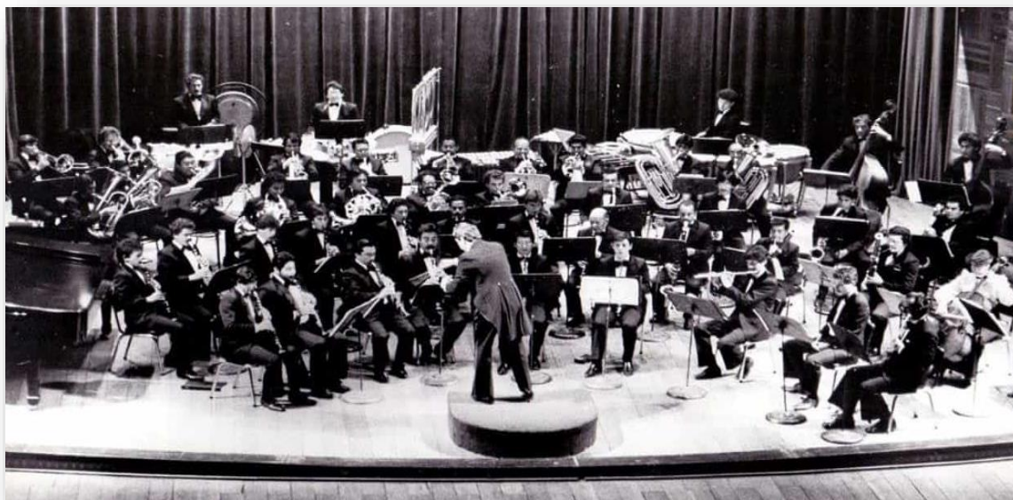
Banda Sinfónica de Vientos de Boyacá.