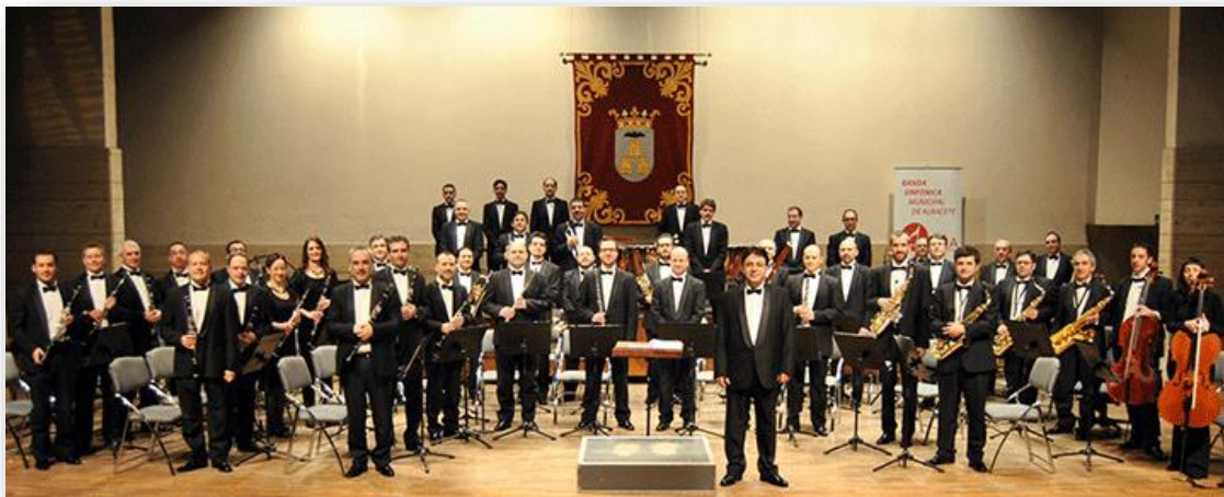
Banda Sinfónica municipal d'Albacete (BSMA)