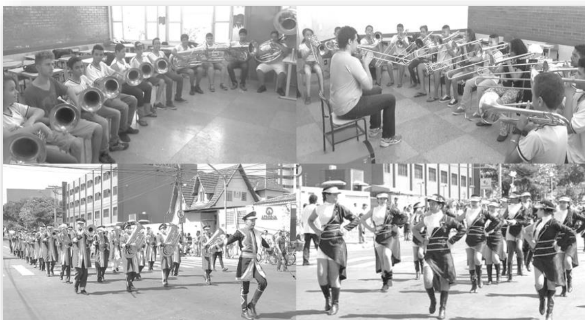
Travail de groupe et prestations de la Banda do Colégio de tempo integral Ismael Silva de Jesus (Brésil)