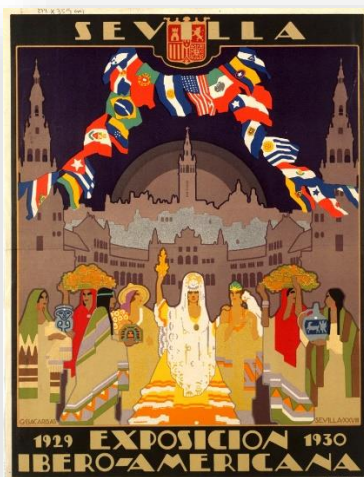
Affiche de l'Exposition Ibéro-américaine (signée Gustavo Bacarissas)

La musique a été l'un des principaux protagonistes de l'Exposition ibéro-américaine à Séville. De mai 1929 à juin 1930, dans différentes parties du site de l'exposition, les ensembles à vent (bandas de música) sévillans ont donné des concerts quotidiens.. De même, les événements, banquets, réunions et danses tenues dans les pavillons et les restaurants de l'exposition étaient fréquemment animés par des groupes musicaux de différents types. En outre, de nombreux concerts ont été donnés par des orchestres, des chœurs, des fanfares, des groupes de chambre et des instrumentistes solistes, tant nationaux qu'internationaux.