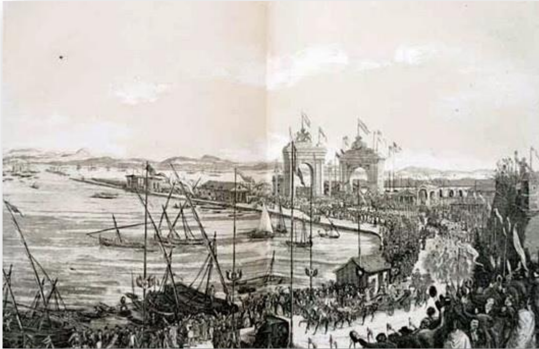
Gravure de l'arrivée d'Isabelle II et de la famille royale à Cadix sur le Guadalquivir. Image tirée de l'œuvre "Crónica del Viaje de sus Majestades y Altezas Reales a Andalucía y Murcia" (Chronique du voyage de Leurs Majestés et Altesses Royales en Andalousie et en Murcie). Fernando Gos-Cayon. Madrid, Imprenta Nacional, 1863.

Pour cette raison, les arcs décoratifs étaient réalisés, les rues ont été décorées et, compte tenu de la nécessité de la musique pour cet événement, la création de groupes musicaux a été encouragée (comme dans le cas de la ville d'Arjonilla) et ceux qui existaient déjà ont été améliorés avec de nouveaux uniformes et instruments (comme, par exemple, la Banda Municipal de Jaén), dans un acte presque sans précédent de propagande locale et de soutien à la monarchie.